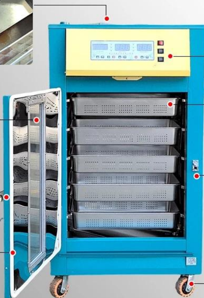
2. Observation window