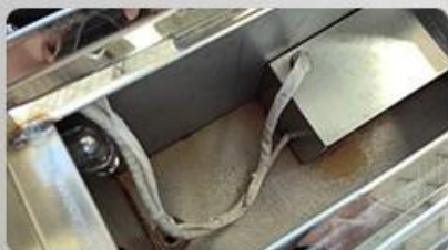
1. Water Tank